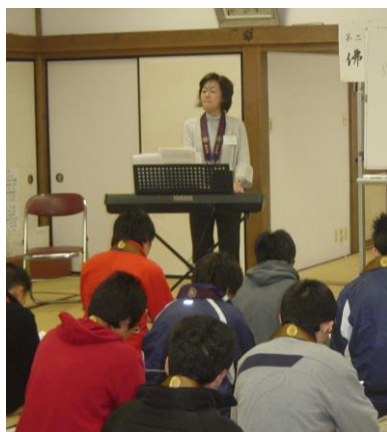
▲講義実習 仏歌による動行