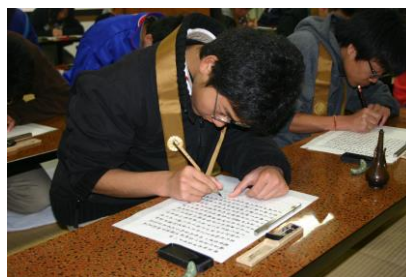
▲心をこめて一字一字丁寧に写経 ▼幹理事長による講義 天台宗の教え