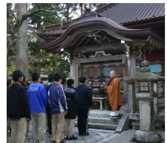
▼林常任理事による講義 仏壇の荘厳