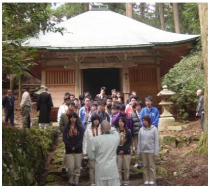
▲諸堂巡拝 延暦寺東塔西塔地区を巡る