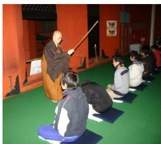
▲早朝釈迦堂で坐禅止観 ▼作務 一生懸命きれいになりました