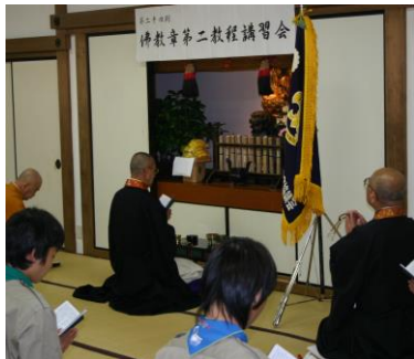
▲幹理事長を導師に法楽

2泊3日の慣れない比叡山での生活の中、食事のとり方、天台宗の教えや家庭勤行の仕方などの講義、諸堂巡拝、最終日の深夜には回峰行を体験。この講習会を終えて、心身共に成長したスカウトたちは各々の団へ帰り、3カ月の奉仕活動を通して教えを实践、さらに信仰を深めたのち日本連盟より名誉ある「宗教章(バッジ)」が授与される。