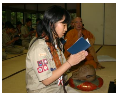
▲スカウトみずから閉会式法楽の導師を勤める