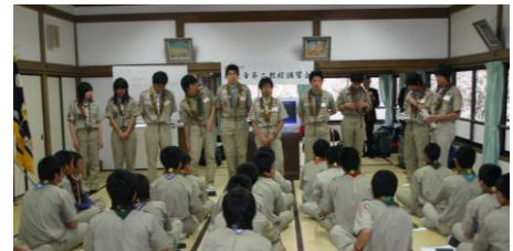
▲各班の班長が選出された