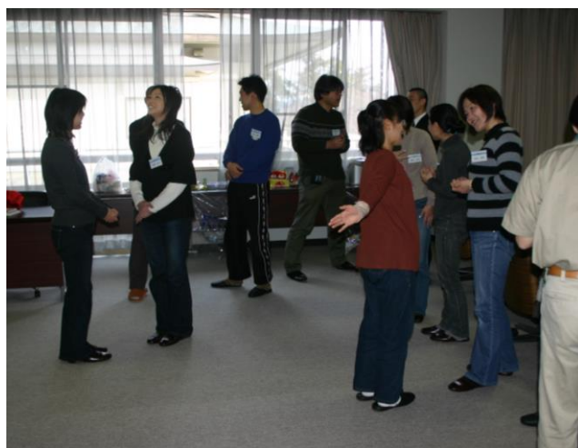
▲ゲームなどを取り入れ和やかな雰囲気の中講習が開始された。