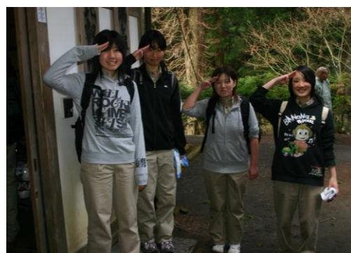
▲回峰行を終えて居士林の前での一コマ