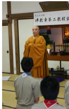
▲今出川居士林所長挨拶