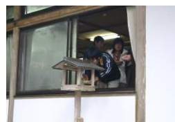
▲与えられた食事の一部を施す 施餓鬼作法